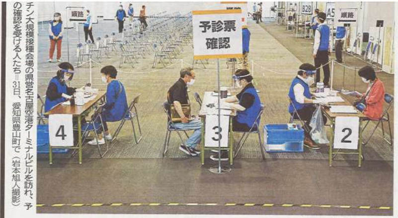
新型コロナウイルスの感染対策で5月24日に高齢者を対象としたワクチンの大規模接種が始まってから1週間が過ぎた。愛知県の会場では予約の枠が埋まらず、現場は余ったワクチンの有効活用に知恵を絞る。一方で、接種は今後、規模が大幅に拡大されるため、各自治体は医療従事者の確保など受け入れ態勢の整備を急いでいる。(水谷元海、池内琢、浅井俊典、出口有紀)